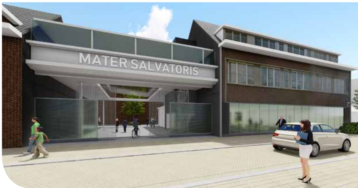
Onze nieuwe schoolingang

In deze basisoptie staan wetenschappelijk-technische verschijnselen en het onderzoekend leren centraal. Heel wat leerplandoelen binnen deze basisoptie bouwen verder op leerplandoelen van de algemene vorming natuurwetenschappen, techniek en wiskunde. Dit verder bouwen gebeurt binnen een