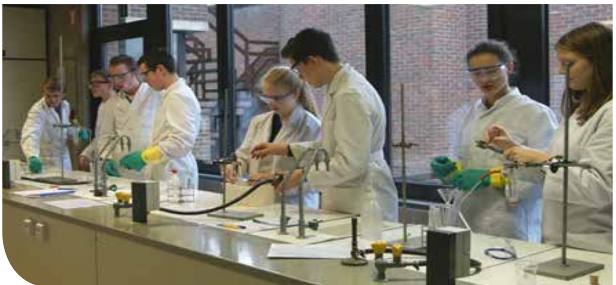
Fysica- en chemielokaal