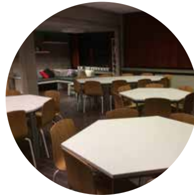
De Oase en de schoolbib.