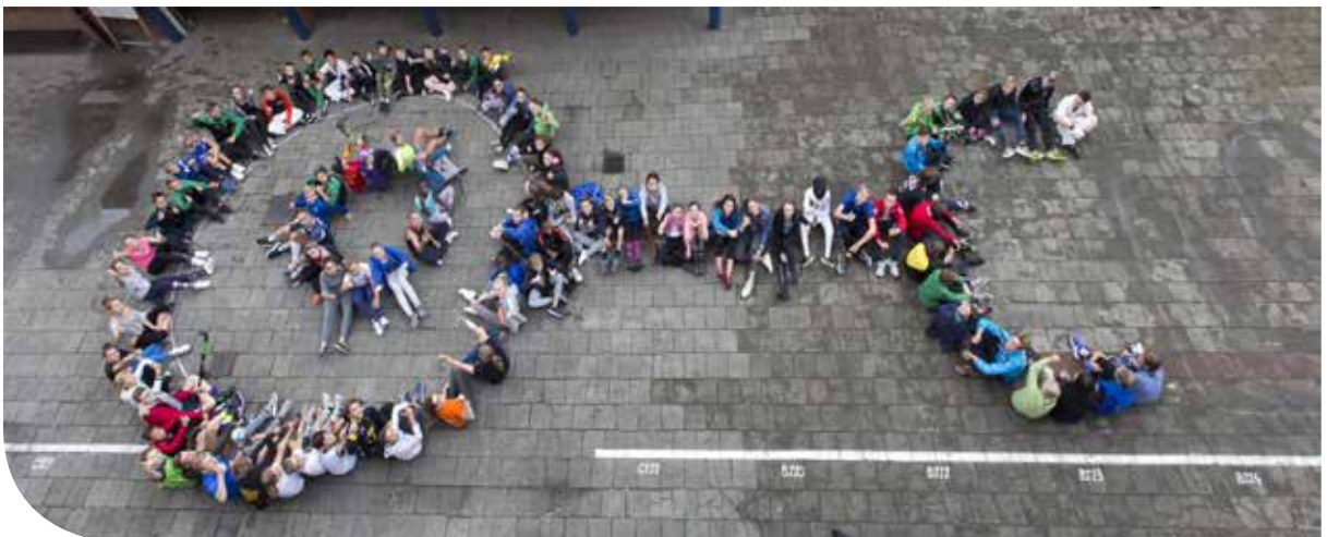
Dag van de sportoutfit

Deze richting combineert een brede algemene vorming met een uitgebreid pakket economie en wiskunde. Je verwerft inzicht in macro- en micro-economische concepten en de werking van ondernemingen. Je leert logisch en kritisch te denken om economische concepten en hun onderlinge verbanden te begrijpen. Je leert abstracte wiskundige concepten te gebruiken en verdiept je wiskundige vaardigheden.