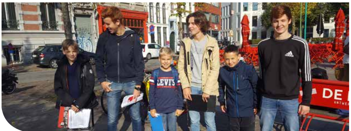
Uitstap naar Antwerpen met peters en meters.