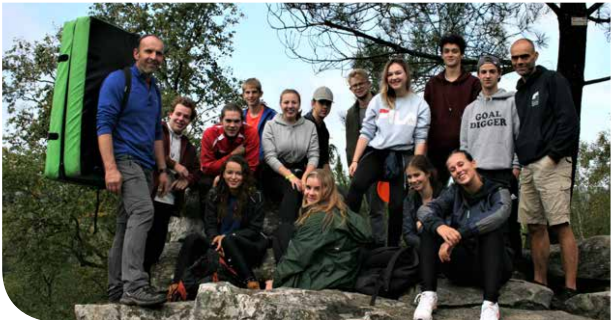
Het vijfde jaar op Uitdaging in de Ardennen.